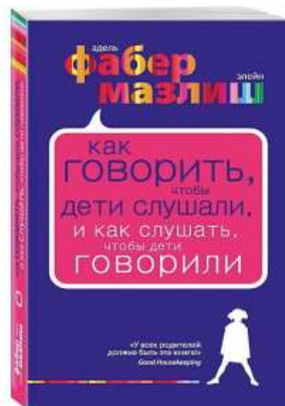
Адель Фабер, Элейн Мазлиш «Как говорить, чтобы дети слушали и как слушать, чтобы дети говорили»