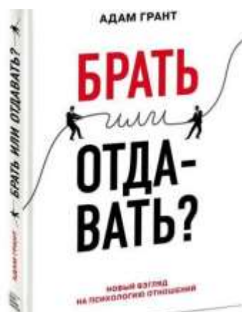
Адам Грант «Брат или отдавать»