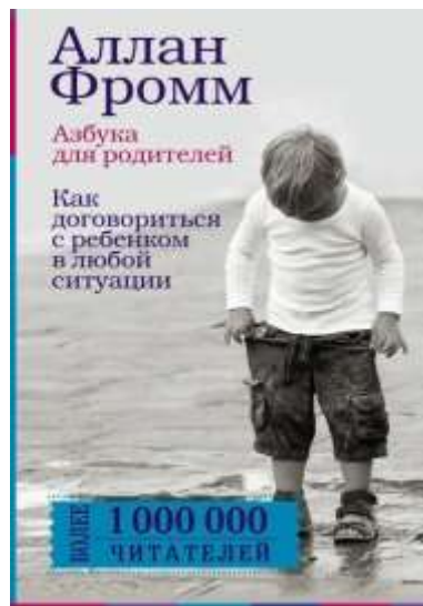
Фромм Аллан. «Азбука для родителей. Как договориться с ребенком в любой ситуации».