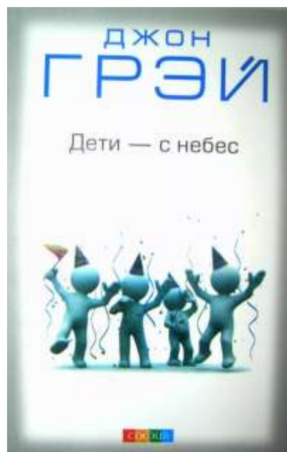
Джон Грэй. Дети - с небес