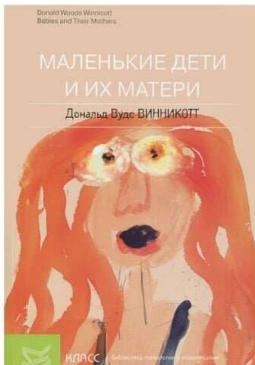
Дональд Вудс Винникотт «Маленькие дети и их матери»