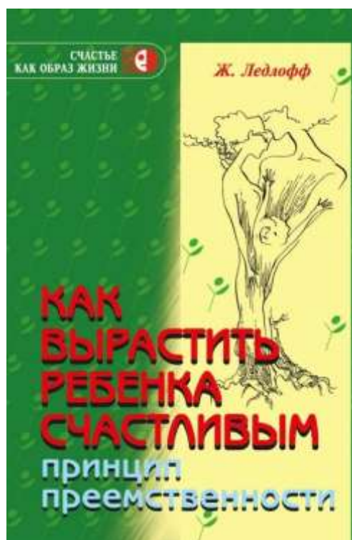
Жан Ледлофф «Как вырастить ребенка счастливым»