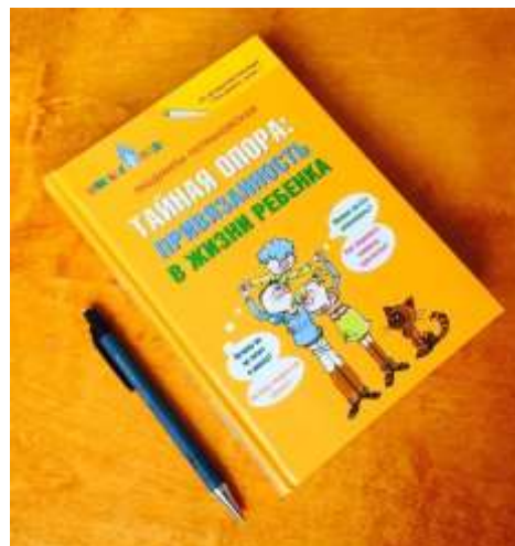
Людмила Петрановская «Тайная опора: привязанность в жизни ребёнка»