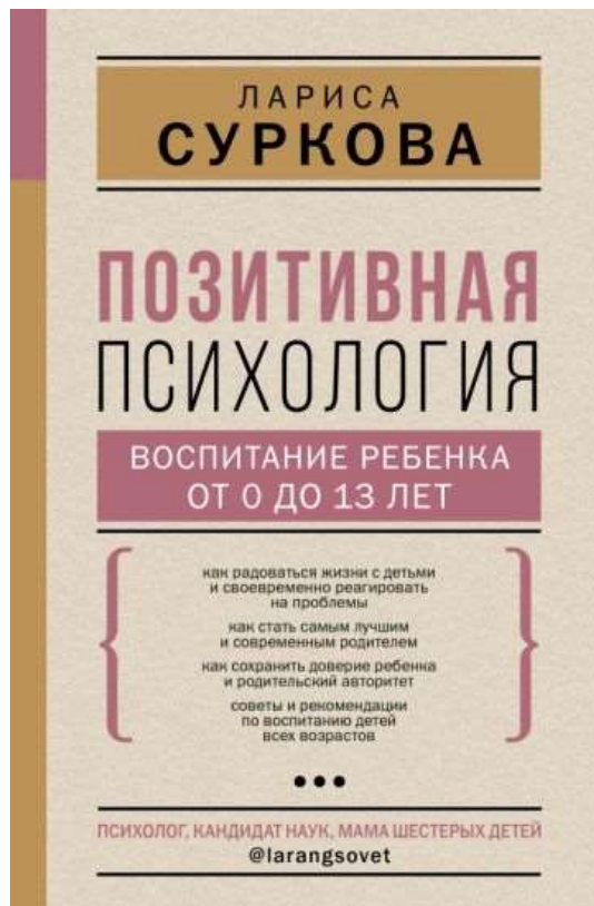
Лариса Суркова. Позитивная психология.