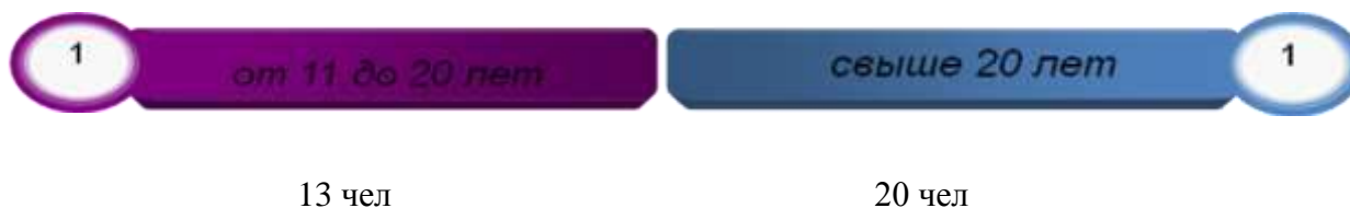
Диаграмма распределения педагогических кадров по стажу работы.

За период 2017-18, 2018-19 годов произошли качественные изменения в образовательном уровне педагогов.